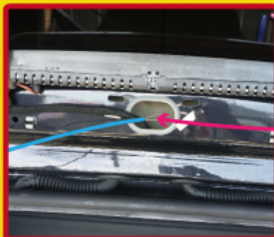
ワイヤーで配線を入れます