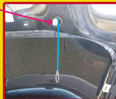
ワイヤーを穴から出します