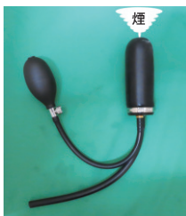
インテークマニホールド用