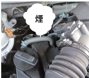
インテークマニホールド用