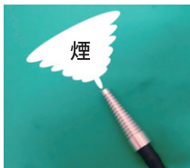
バキュームホース用