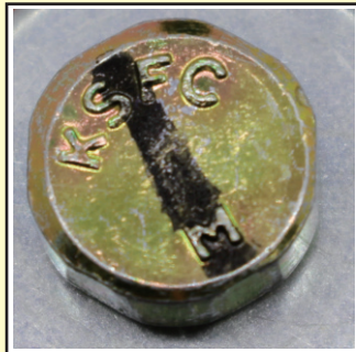
頭がなめたボルト