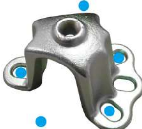
609 (アクスルプーラー)