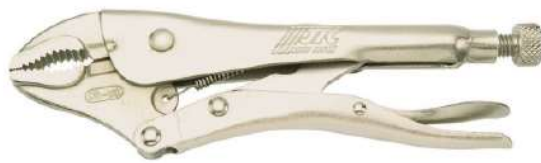
JTC10WR (ロックングプライヤー)