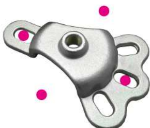
603 (アクスルプーラー)