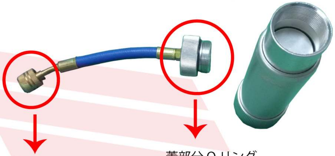
ホース先端 Oリング