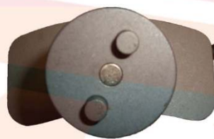
アダプターなしの状態