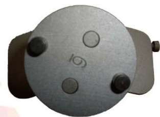
アダプター取り付け状態