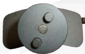
アダプターなしの状態