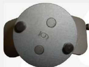
アダプター取り付け状態