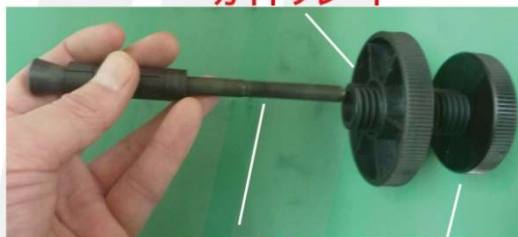
センターボルト メインシャフト