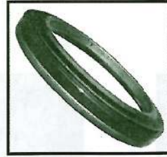
Front oil seal: BZ4365E