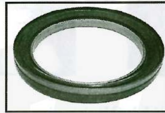
Rear oil seal: BZ4219E