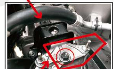
エンジンマウントボルト A