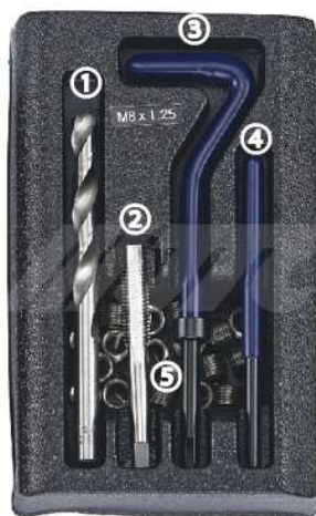
JTC4780 ~ JTC4788