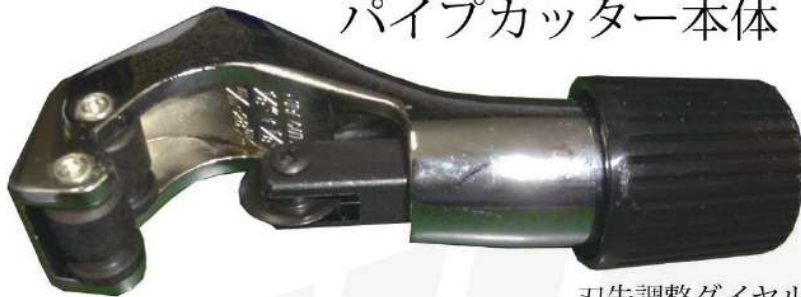
刃先調整ダイヤル