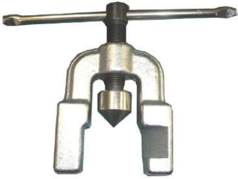
パイプフレアーツール本体