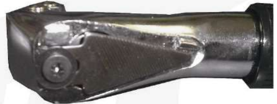
本体背面にヤスリが付いています。