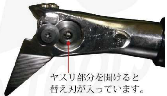
ヤスリ部分を開けると 替え刃が入っています。