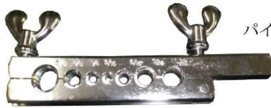
パイプ固定用治具